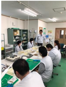
火災発生、避難指示

11月1日（金）に火災を想定した避難訓練を行いました。冬は一年でもっとも空気が乾燥し、ストーブなど大きな熱を持つ暖房器具が頻繁に行われる季節。万が一の事態に備え、実際に避難経路を確認した後、火災の特徴、原因や火災時の対応等の確認や、防災情報発令時の出勤判断の取り決めを全員で共有しました。万が一の事態に適切な行動を取れる様、日頃から心がけて参りたいと思います。