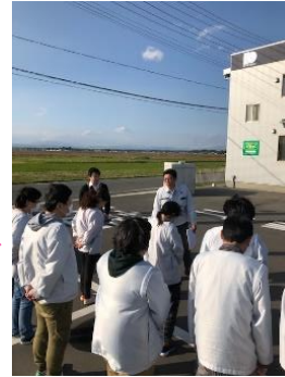
避難場所へ到着、点呼